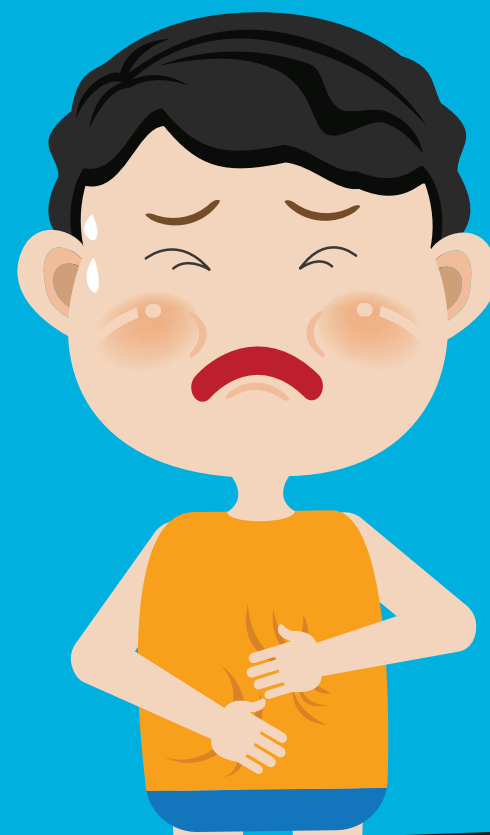
PANANAKIT NG TIYAN