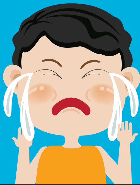
PAG-IYAK NANG WALANG DAHILAN