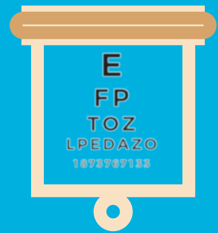
ស្រវាំងភ្នែក