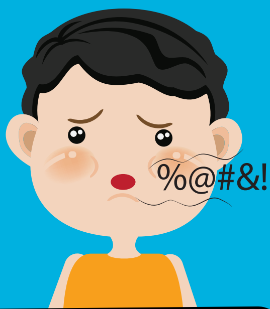
ពិបាកក្នុងការនិយាយ អោយច្បាស់