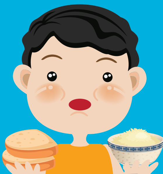
ឃ្នានខ្លាំង