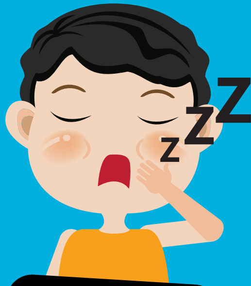
អស់កម្លាំង