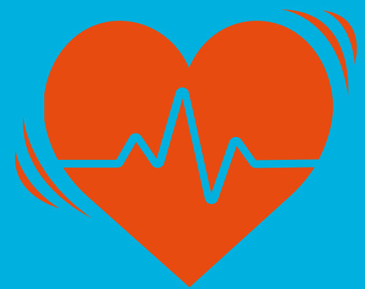
បេះដូងងើរញាប់